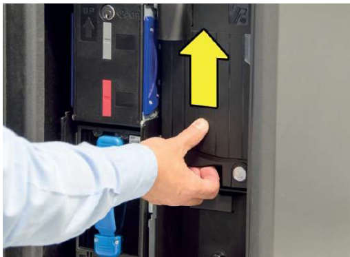
Presionar hacia arriba