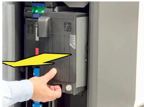
Extraer el dispensador

Abrir la tapa superior y vaciar de monedas: